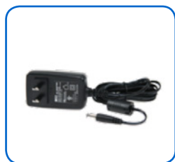
Adaptateur de courant